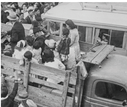
▲ Groupe de Canadiennes et de Canadiens japonais transportés vers le camp de Slocan (Colombie-Britannique), 1942

Libertés sacrifiées examine les crises qui ont motivé ces événements et présente les récits poignants d'hommes, de femmes et d'enfants qui les ont vécus.